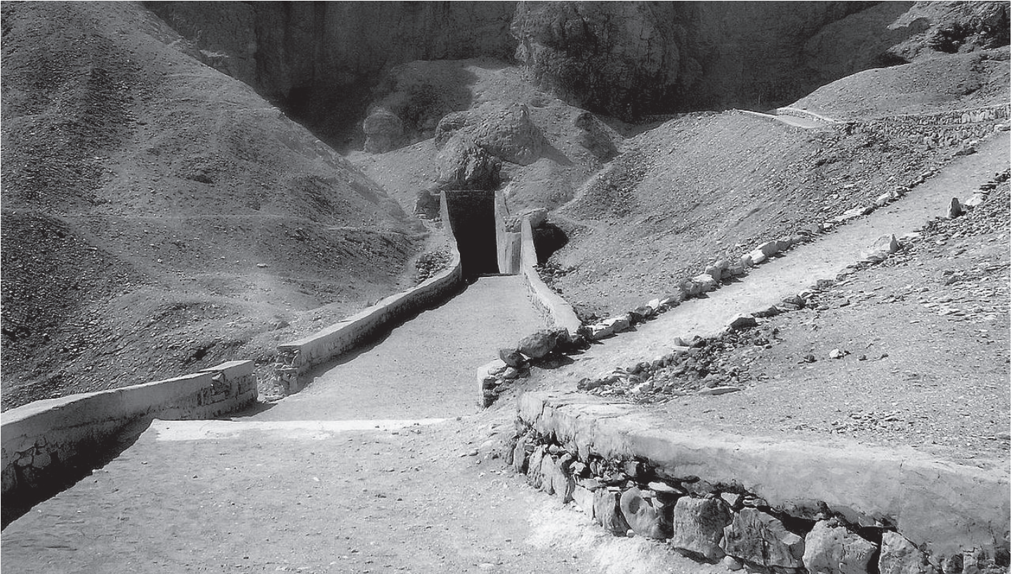
Grabzugang im Tal der Könige in Ägypten.