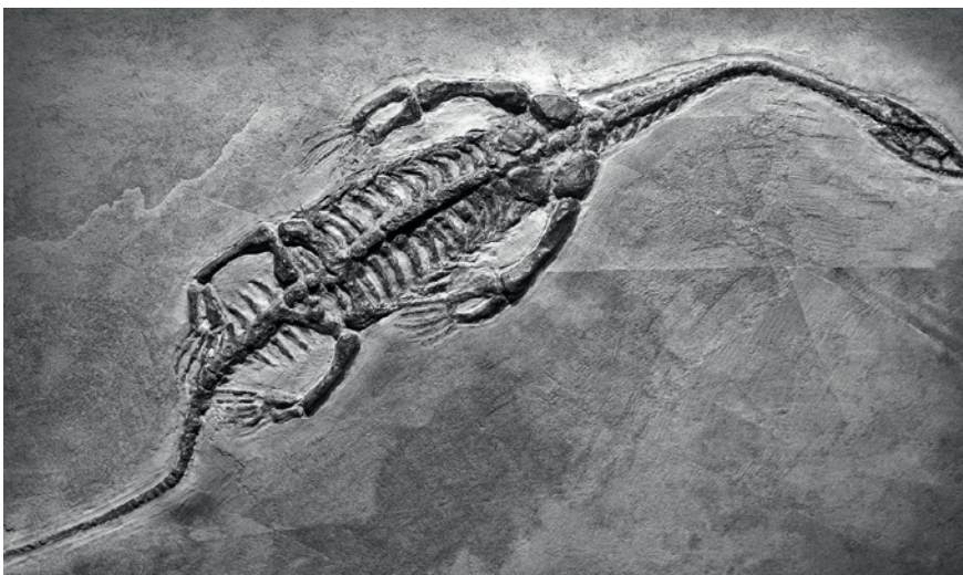
Fossilien können während Millionen Jahren «begraben» sein.

In jener Zeit gab es die Tethys, ein flaches Meer zwischen den Urkontinenten Laurasia und Gondwana. Die Ablagerungen auf diesem Meeresboden bildeten nebst anderen Gesteinen den Opalinuston. Damals lebende Tiere